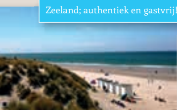
Zeeland; authentiek en gastvrij!