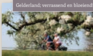
Gelderland; verrassend en bloeiend!