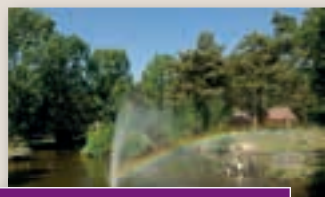
Limburg; onvergetelijk en mooi!