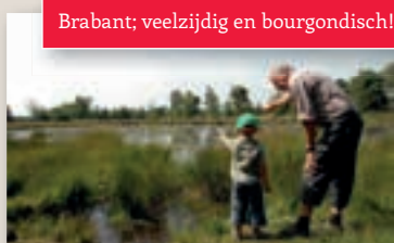
Brabant; veelzijdig en bourgondisch!